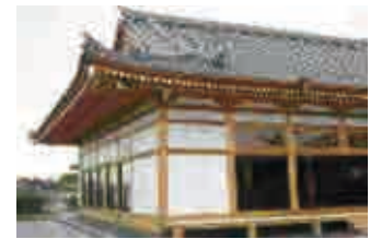
白木の美しさを維持する